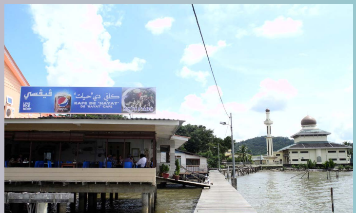
SALAH satu perusahaan makanan iaitu soto yang diusahakan oleh anak tempatan yang terletak di Kampung Pintu Malim.