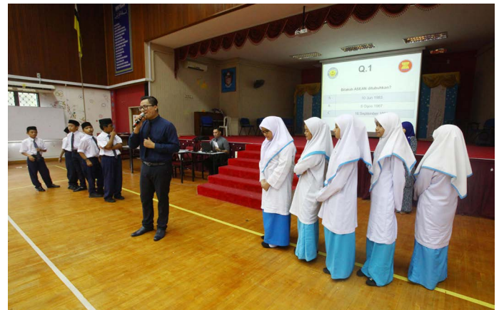
SESI kuiz juga turut diadakan dalam menguji pengetahuan para pelajar mengenai ASEAN.

Di samping itu, ia juga bagi mengukuhkan hubungan Jabatan Penerangan dengan masyarakat khususnya para penuntut di negara ini.