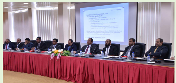
ROMBONGAN dari Command and Staff College of Saudi Arabia semasa mendengarkan taklimat semasa lawatan mereka ke Jabatan Penerangan.