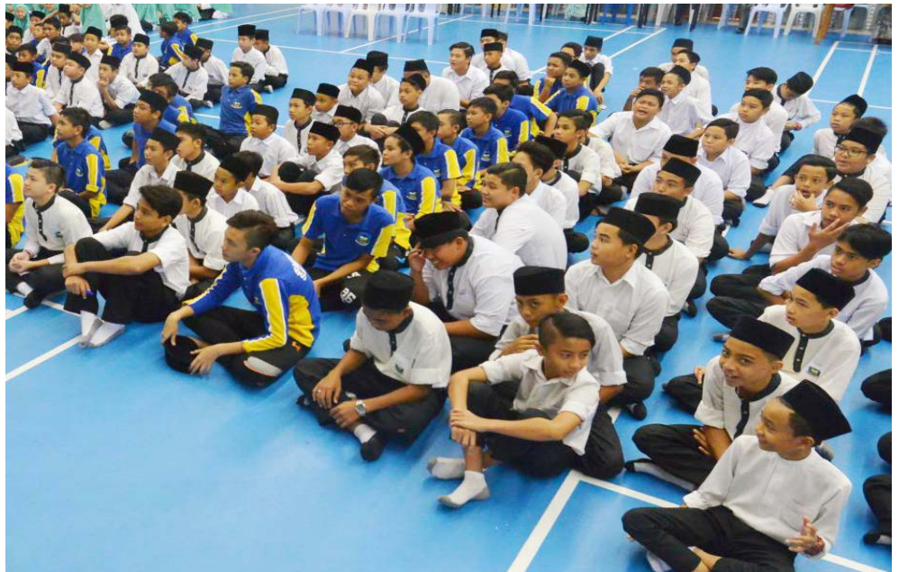
ANTARA murid-murid Tahun 7 dan 8 yang hadir di jerayawara tersebut.

Turut diketengahkan pada taklimat itu ialah maklumat mengenai Wawasan 2035 selaras dengan statistik perbandingan Negara Brunei Darussalam di arena serantau.