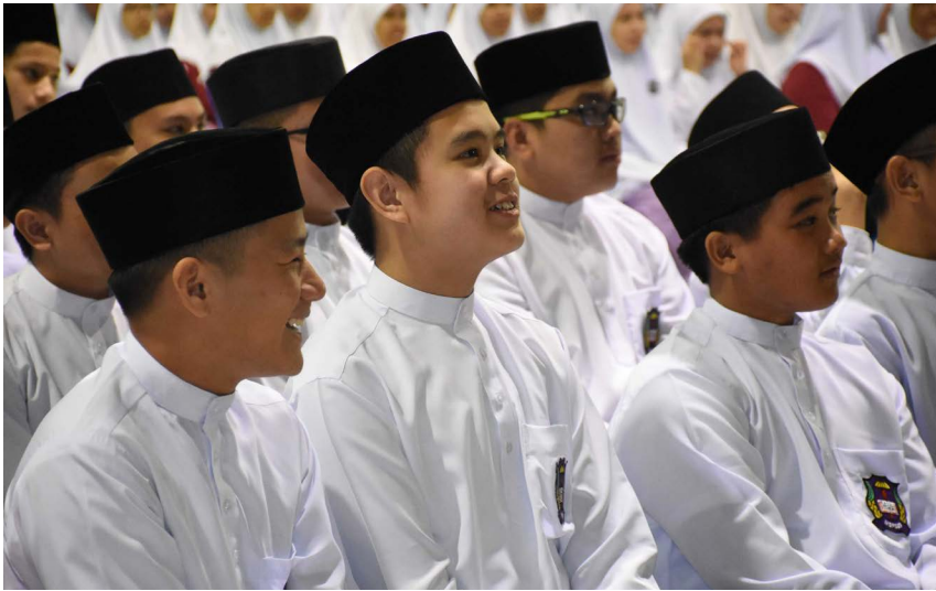
ANTARA para pelajar lelaki yang menghadiri taklimat tersebut.

B ERAKAS, Sabtu, 21 Januari. - Dalam usaha untuk menyuntik semangat patriotisme dan sifat perpaduan (ASEAN-ness) dalam kalangan penuntut, Jabatan Penerangan, Jabatan Perdana Menteri melalui Unit Hal Ehwal Antarabangsa, selaku Sekretariat bagi Jawatankuasa Kecil Penerangan ASEAN- COCI telah mengadakan Jerayawara Kenali ASEAN yang berlangsung di tiga buah sekolah berasingan yang bermula di Maktab Sains Paduka Seri Begawan Sultan disini.