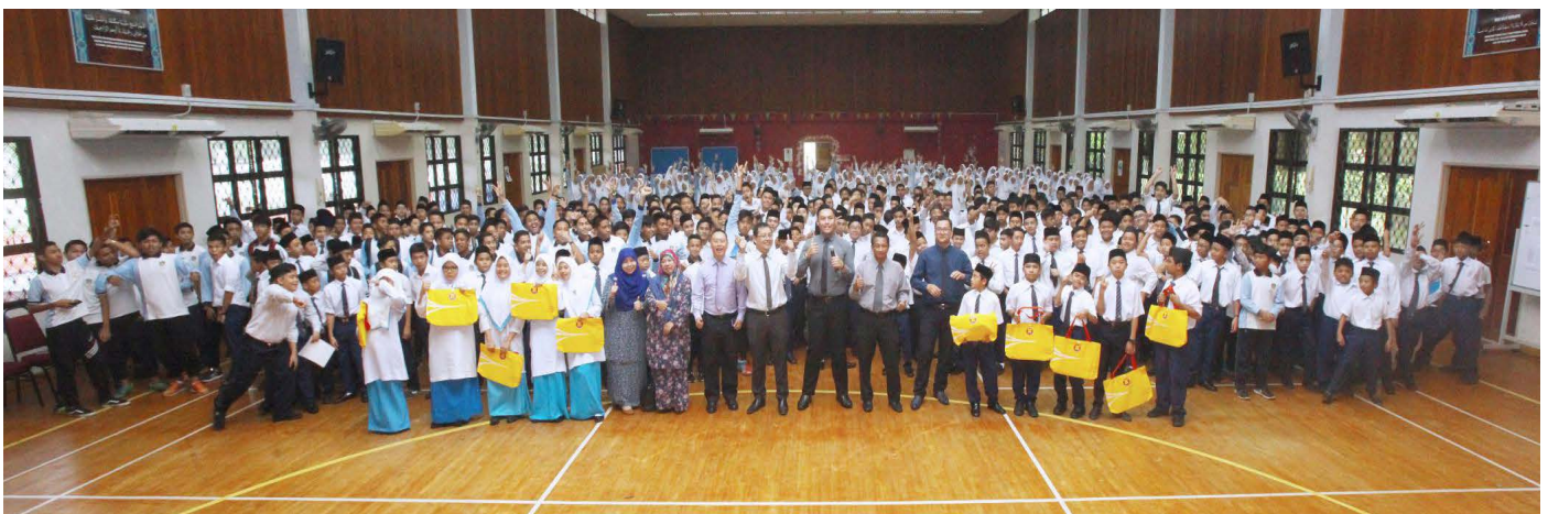
SERAMAI 600 penuntut SMB bergambar ramai selepas mendengarkan taklimat berkaitan ASEAN yang diadakan di dewan sekolah tersebut.