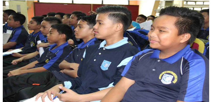
PELAJAR-PELAJAR lelaki (atas) dan perempuan (kiri) Tahun 7 semasa mendengarkan taklimat yang disampaikan.