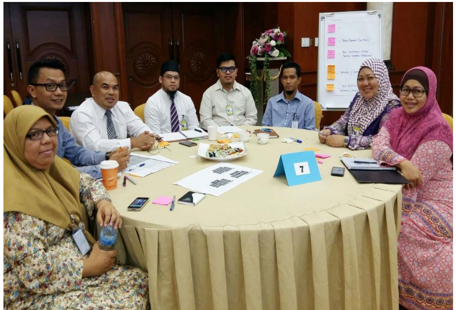
PEMANGKU Pengarah Penerangan, Awang Mawardi bin Haji Mohammad berserta pegawai dan kakitangan Jabatan Penerangan sewaktu menghadiri kursus berkenaan.

Antara objektif bengkel tersebut diadakan adalah sebagai pengenalan terhadap kerangka kerja Wawasan Brunei 2035 dan Pelan Komunikasi Wawasan Brunei 2035. Selain itu ianya juga bagi memahami cabaran-cabaran untuk menyampaikan Wawasan 2035 kepada orang ramai serta memahami penyelesaian bagi cabaran-cabaran yang dihadapi disamping bekerjasama untuk menyampaikan Wawasan 2035 kepada orang ramai.