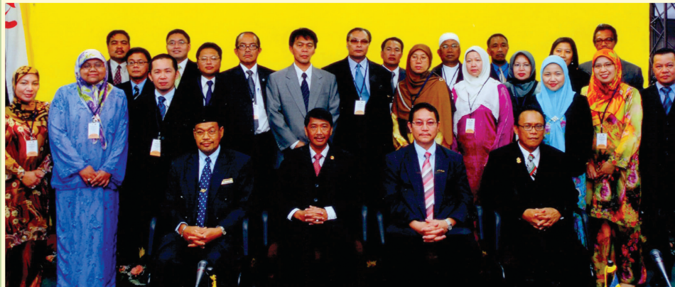
Para pegawai kanan dan pegawai-pegawai dari kedua buah negara yang menghadiri mesyuarat berkenaan.

Mesyuarat Ke-3 Jawatankuasa Eksekutif Bersama Memorandum Persefahaman Dalam Bidang Penerangan antara Kerajaan Kebawah Duli Yang Maha Mulia Paduka Seri Baginda Sultan Dan Yang Di-Pertuan Negara Brunei Darussalam dengan Kerajaan Malaysia bermula pada 18 Jun 2008 bertempat di Jabatan Penerangan, Jabatan Perdana Menteri, Negara Brunei Darussalam.