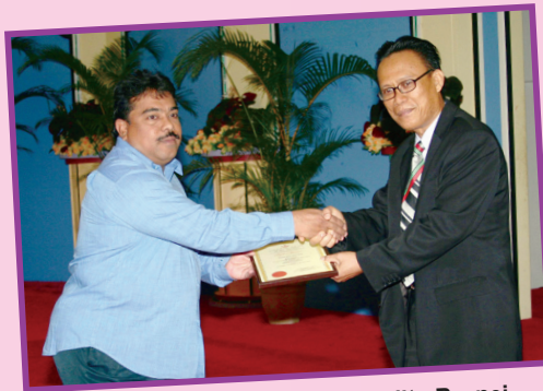
Salah seorang wakil pendedar Pelita Brunei menerima sijil sebagai pendedar.

Brunei. Beliau juga menambah, akhbar atau majalah yang pernah diterbitkan di negara ini yang sebilangannya masih bertahan hingga sekarang seperti Borneo Bulletin.