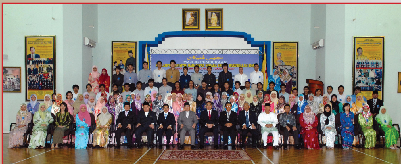
Gambar ramai peserta Perkampungan Sivik Mahasiswa Negara Brunei Darussalam 2008 bersama Yang Berhormat Menteri Hal Ehwal Dalam Negeri.

Jabatan Penerangan, Jabatan Perdana Menteri dengan kerjasama Kementerian Pendidikan, Kementerian Hal Ehwal Ugama dan Syarikat Minyak Brunei Shell Sdn. Bhd. telah mengadakan Program Perkampungan Sivik Mahasiswa Negara Brunei Darussalam 2008 pada 1 hingga 5 Syaaban 1429 / 3 hingga 7 Ogos bertempat di Voctech International House, Seameo Voctech, Jalan Pasar Baru Gadong.