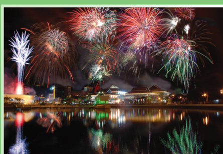
'Fireworks Extravaganza' oleh Awang Abdul Kadir bin Mohd. Tahir yang memenangi Kategori Jurugambar.

Dengan tema 'Suasana Perayaan (62 nd Sultan Birthday Celebration)', Peraduan Anugerah Fotografi Terbaik 2008 – 2009 diteruskan lagi bagi bulan Julai yang penyertaannya dibukakan mulai 15 Julai – 15 Ogos.