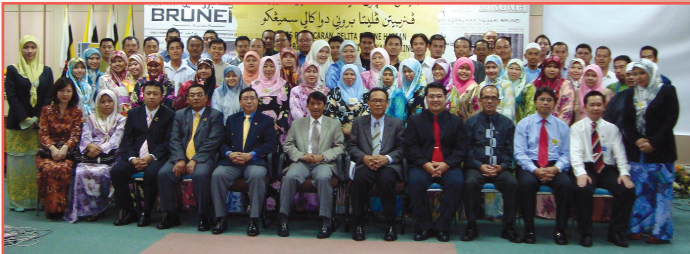
Pengarah dan Timbalan Pengarah Penerangan, para pegawai Jabatan Penerangan, RBC, penceramah dan pengendali kursus merakamkan gambar kenangan bersama para peserta.

Jabatan Penerangan telah mengadakan Kursus Pembinaan Kapasiti Diri dan Kapasiti Organisasi bermula pada 25 hingga 27 Ogos.