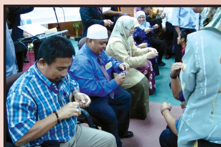
Para peserta kursus ketika melakukan aktiviti menguji kecekapan mental.