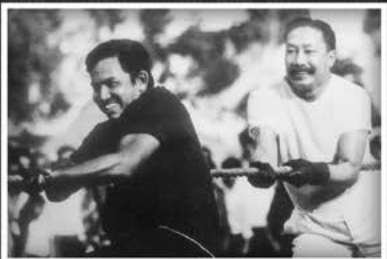
Sultan Haji Omar Ali Saifuddin III dan Keibawah Duli Yang Maha Mulia Paduka Seri Baginda Sultan Hassanali Bolkiah Mu'izzaddin Waddaulah, Sultan dan Yang Di-Pertuan Negeri Brunei Darussalam menyertai acara Sukan Terak Karat yang diadakan di Padang Besar, Bandar Brunei pada 22 Februari 1973.