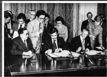
Keibawah Duli Yang Maha Mulia menandatangani Perjanjian Persahabatan dan kerjasama Brunei-Great Britain di London pada 29 September 1978.