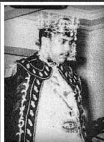
Kebawah Duli Yang Maha Mulia ketika dicalarkan menjadi Yang Teramat Mula Paduka Seri Duli Pengiran Muda Mahkota di Istana Darul Hana, Bandar Brunei, pada 14 Ogos 1961.