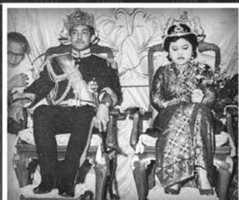
Yang Teramat Mula Paduka Seri Duli Pengiran Muda Hassanal Bolkiah menanjungkan perkahwinan dengan Yang Amat Mulia Pengiran Anak Saleha binti Al-Marhum Pengiran Ponnandah Pengiran Anak Hajj Mohamed Alam pada 29 Julai 1965.