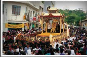
Kebawah Duli Yang Maha Mulia bersempam di atas Pitaristna Usungan Diraja semasa Istiadat Perarakan Mengelilingi Bandar Seri Begawan Sempena Jubli Parak Baginda Meraki Takhta pada 5 Oktober 1992.