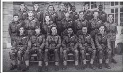
Yang Teramat Mulia Paduka Seri Duli Pengiran Muda Hassanal Bolkiah ketika mengikuti kursus Kotenteraan di Akademi Tentera Diraja, Sandhurst, United Kingdom dalam tahun 1966