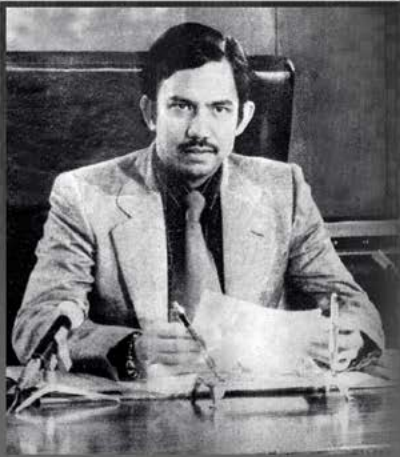
Kebawah Duli Yang Maha Mulia Paduka Seri Baginda Sultan Hassanal Bolkiah Mu'azzadin Waddaulah ibni Al-Muhammadiyah Hajj Omar 'Al-Salfaddin Sa'adul Kham Weddien, Sultan dan Yang Di-Pertuan Negara Brunei Darussalam di awal tahun 1979.