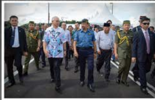
Jambatan Pensahabalan antara Negara Brunei Darussalam dan Malaysia yang menghubungkan Daerah Temburong dan Negeri Sarawak diasmakan pada 6 September 2015 sebagai jambatan penghubung kepada penempatan dan pembangunan antara dua negara, memudakan hubungan jalan darat dan mengubah lanskap pembangunan dan memacu ekonomi masyarakat setempat.

Petikan Titah Kebawah Duli Yang Maha Mulia Paduka Seri Baginda Sultan Haji Hassanal Bolkiah Mu'izzaddin Waddaulah ibni Al Marhum Sultan Haji Omar 'Ali Sa'uddien Sa'adul Khairi Waddien, Sultan dan Yang Di Pertuan Negara Brunei Darussalam Sempena Menwambut Awal Tahun Baru Masihi 2015 pada hari Rabu 9 Rabiulawal 1436H bersamaan 31 Disember 2014M, London, United Kingdom.