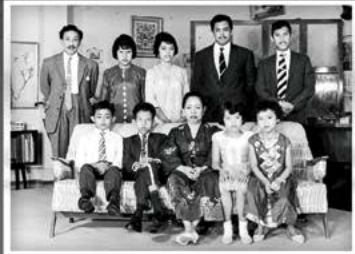
Yang Teramat Mulia Paduka Seri Duli Pengiran Muda Hassanal Bolkiah bersama dengan pacuka ayahanda dan bonda serta adinda-adinda beginda

Titah Pertama Duli Yang Maha Mulia Paduka Seri Sultan Hassanal Bolkiah Mu'izzaddin Waddaulah pada hari perlantekan beginda sebagai Sultan di Istana Darul Hana. (Petikan Titah pada 5 Oktober 1967)