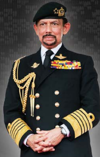
Kebawah Duli Yang Maha Mulia semasa berkerabat di Istana Negara.