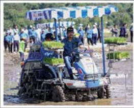
Majlis Menuai Padi Laila yang diadakan pada 3 Ogos 2009 adalah usaha untuk memajukan lagi industri penanaman padi, di samping meningkatkan hasil pengeluaran beras di Negara Brunei Darussalam.

Petikan Titah Kebawah Duli Yang Maha Mulia Paduka Seri Baginda Sultan dan Yang Di-Pertuan Negara Brunei Darussalam Sempena Perasmian Majlis Mesyuarat Negara Kali Ke-4 pada 26 Safar 1429 Hijrah bersamaan 2 Mac 2008 Masihi.