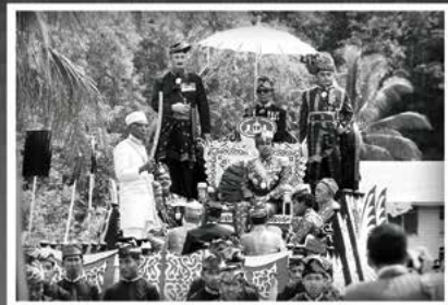
Kemalangan Diraja yang membawa Kebawah Duli Yang Maha Mulia menuju ke Lapangan untuk upacara Perpusapan pada 1 Ogos 1968.

Titah Duli Yang Maha Mulia Paduka Seri Baginda Sultan dan Yang Di-Pertuan Negeri Brunei sebelum merasmikan Kilang LNG. (Petikan Titah pada 4 April 1973)