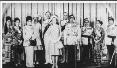
Keibawah Duli Yang Maha Mulia dan Keibawah Duli Yang Maha Mulia Baginda Raja Isteri dan Yang Maha Mulia Baginda Queen Elizabeth II dan kerabat-kerabat diraja ketika bergambar ramai di Istana Darul Hana sempena lawatan Baginda Queen Elizabeth II ke Brunei Darussalam pada 29 Februari 1972.