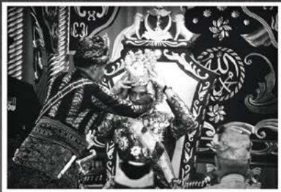
Sultan Haji Omar Ali Saifuddin Salatul Khairi Waddien memahkotakan Kebawah Duli Yang Maha Mulia Paduka Seri Baginda Sultan Hassanali Bolkiah Mu'izzaddin Waddaulah di Hari Perpusapan pada 1 Ogos 1968. Bismillah baginda juga dikenali sebagai "Sultan dan Yang Di-Pertuan".