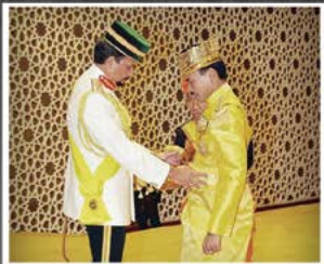
Kebawah Duli Yang Maha Mulia di Istana Permaisuri Yang Teramat Mulia Paduka Seri Begonia Permaisuri Halimah Bte. Tunjaja Sultan Haji Hassanal Bolkiah menerima Duli Yang Teramat Mulia Paduka Seri Pengiran Muda Mahkota di Istana Nurul Iman pada 10 Ogos 1998.

Titah Kebawah Duli Yang Maha Mulia Paduka Seri Baginda Sultan Haji Hassanal Bolkiah Mu'izzaddin Waddaulah ibni Al-Marhum Sultan Haji Omar 'Ali Sa'uddien Sa'adul Khairi Waddien, Sultan dan Yang Di-Pertuan Negara Brunei Darussalam Sempena Sambutan Jubli Perak di Istana Nurul Iman pada 5 Oktober 1992.