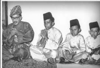
Yang Taramat Mulia Paduka Seri Duli Pengiran Muja Hassanal Bolkiah bersama paduka ayahandanya baginda Sultan Haji Omar 'Ali Saifuddien Sa'adul Khairi Waddien dan adinda-adinda baginda ketika Istiadat Mengadap dalam tahun 1950-an.