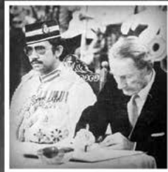
Kebawah Duli Yang Maha Mulia menandatangani Perjanjian Persahabatan dan Kerjasama di antara Negeri Brunei dengan Great Britain di Lapau, Bandar Seri Begawan pada 7 Januari 1979.