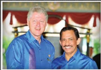
Kebawah Duli Yang Maha Mulia berkenan bergambar bersama Presiden Amerika Syarikat, Tuan Yang Terutama Presiden Bill Clinton di Perisidangan APEC 2000 pada 26 November 2000.