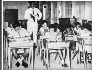
Yang Taramat Mulia Paduka Seri Duli Pengiran Muja Hassanal Bolkiah mengikuti Private Tuition di Surau, Istana Darul Hana, Bandar Brunei, dalam tahun 1950-an.