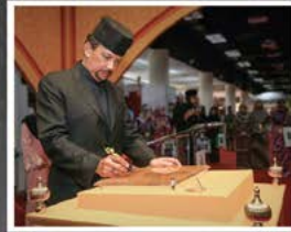
Peruisan Mushaf Al-Quran memberi imej tersendiri kepada Brunei dan melibatkannya sebaris dengan negara Islam lainnya. Inisiatif sebegini satu sejarah di Majlis Perasmian Mahkamah Bahat (adanya) Pertama dan Kedua Perasmian Peruisan Mushaf Al-Quran UMSSA pada 24 Oktober 2011, di Pusat Persidangan Antarabangsa, Berakas.