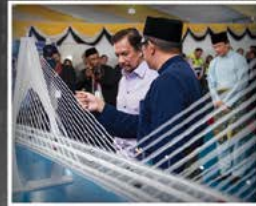
Kobawah Duli Yang Maha Mulia berkenan menyaksikan pameran mengenai keseluruhan pembinaan jambatan Temburong setelah Upacara Peletakan Batu Asas Projek Jambatan Penghubung di antara Daerah Brunei dan Muara dengan Daerah Temburong sepanjang lebih 30 kilometer pada 16 Januari 2016.