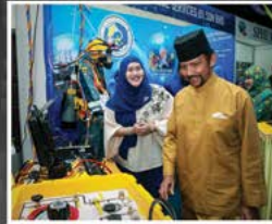
Para profesional muda dan usahawan belia memimpin tonggak kekuatan negara sebagai penerus kepimpinan masa depan bagi mencapai Wawasan Negara 2035 adalah antara peserta KADYIM dalam Majlis Sambutan Hari Raya Adhika anjuran Yayasan Sultan Haji Hassanal Bolkiah (YSHHB) pada 30 Julai 2016.