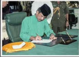
Kebawah Duli Yang Maha Mulia Paduka Seri Baginda Sultan Haji Hassanal Bolkiah Mu'azzad Billah Walisyalahi, Sultan dan Yang Di-Pertuan Negara Brunei Darussalam ketika berikrar berangkat ke Majlis Perasmian Pelancaran Tabung Amanah Islam Brunei (TAIB) pada 29 September 1991.

Titah dalam Majlis Perasmian Pelancaran Tabung Amanah Islam Brunei (TAIB), di Bangunan Perdagangan Bumiputra, Jalan Cator, Bandar Seri Begawan, Negara Brunei Darussalam, pada hari Ahad 29 September 1991 bersamaan 21 Rabiulawal 1412.