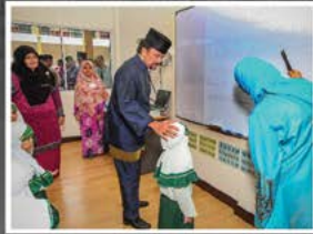
Dalam usaha memartabatkan kualiti pendidikan khasnya di bidang pendidikan berlandaskan Al-Quran, kemajuan dalam bidang prasarans dan kerchanaan terus dipertingkatkan dengan membina institusi pendidikan dan alayana Baginda ketika berkenan berangkat ke Majlis Perasmian Bangunan Baru Sekolah Al-Falaah pada 20 Oktober 2011.