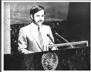
Kebawah Duli Yang Maha Mulia beristiadat sempena kompasukan Negara Brunei Darussalam dengan rasminya menjadi ahli Pertubuhan Bangsa-Bangsa Bersatu (PBB) Ke-159 di Majlis Pertampunan Agung PBB Ke-39 di Ibu Pejabat PBB, New York pada 21 September 1984.