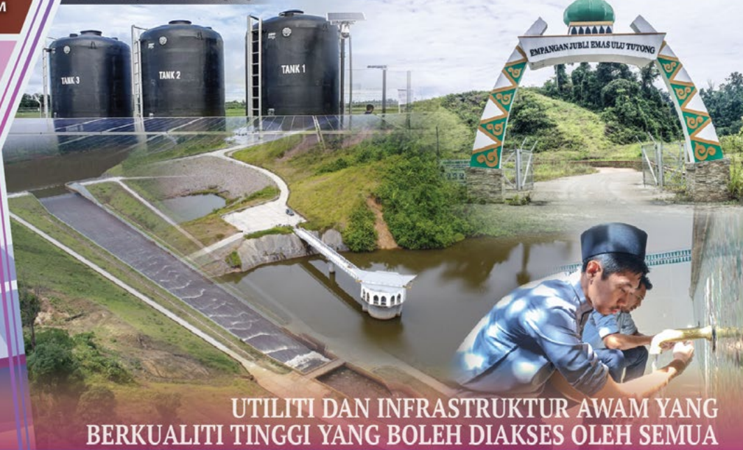
Projek Telaga Kekal Air Bawah Tanah Kawasan Kemajuan Pertanian Lot Sengkuang

UTILITI DAN INFRASTRUKTUR AWAM YANG BERKUALITI TINGGI YANG BOLEH DIAKSES OLEH SEMUA