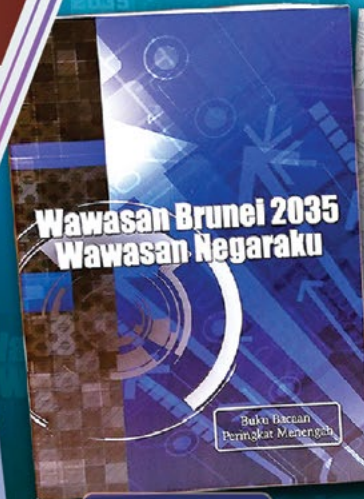
Buku Bacaan Peringkat Menengah

Petikan Titah Kebawah Duli Yang Maha Mulia Paduka Seri Baginda Sultan Haji Hassanal Bolkiah Mu'izzaddin Waddaulah ibni Al-Marhum Sultan Haji Omar 'Ali Saifuddin Sa'adul Khairi Waddien, Sultan dan Yang Di-Pertuan Negara Brunei Darussalam sempena Istiadat Pembukaan Rasmi Persidangan Majlis Mesyuarat Pertama dari Musim Permesyuaratan Ke-4 Majlis Mesyuarat Negara, pada hari Selasa, 27 Safar 1429H bersamaan 4 Mac 2008M