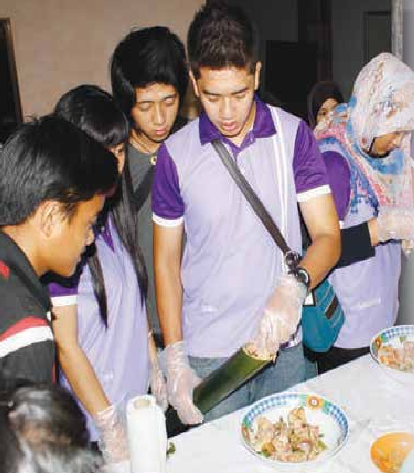
AKTIVITI penyediaan makanan tradisi puak Iban.