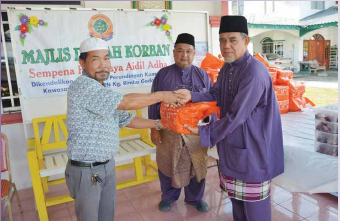
PENGAGIHAN daging ibadah korban kepada orang-orang yang berhak menerimanya.