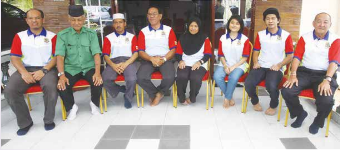
SEBAHAGIAN Ahli Majlis Perundingan Kampung (MPK) STKRJ Kampung Rimba.

mata untuk memajukan dan memberikan kesejahteraan kampung berkenaan. Dengan adanya semangat bersatu padu dan saling bekerjasama sepertimana yang diharapkan itu maka kawasan STKRJ diharap tidak akan jauh ketinggalan dari kampung-kampung lain dalam apa jua aktiviti yang dirancang.