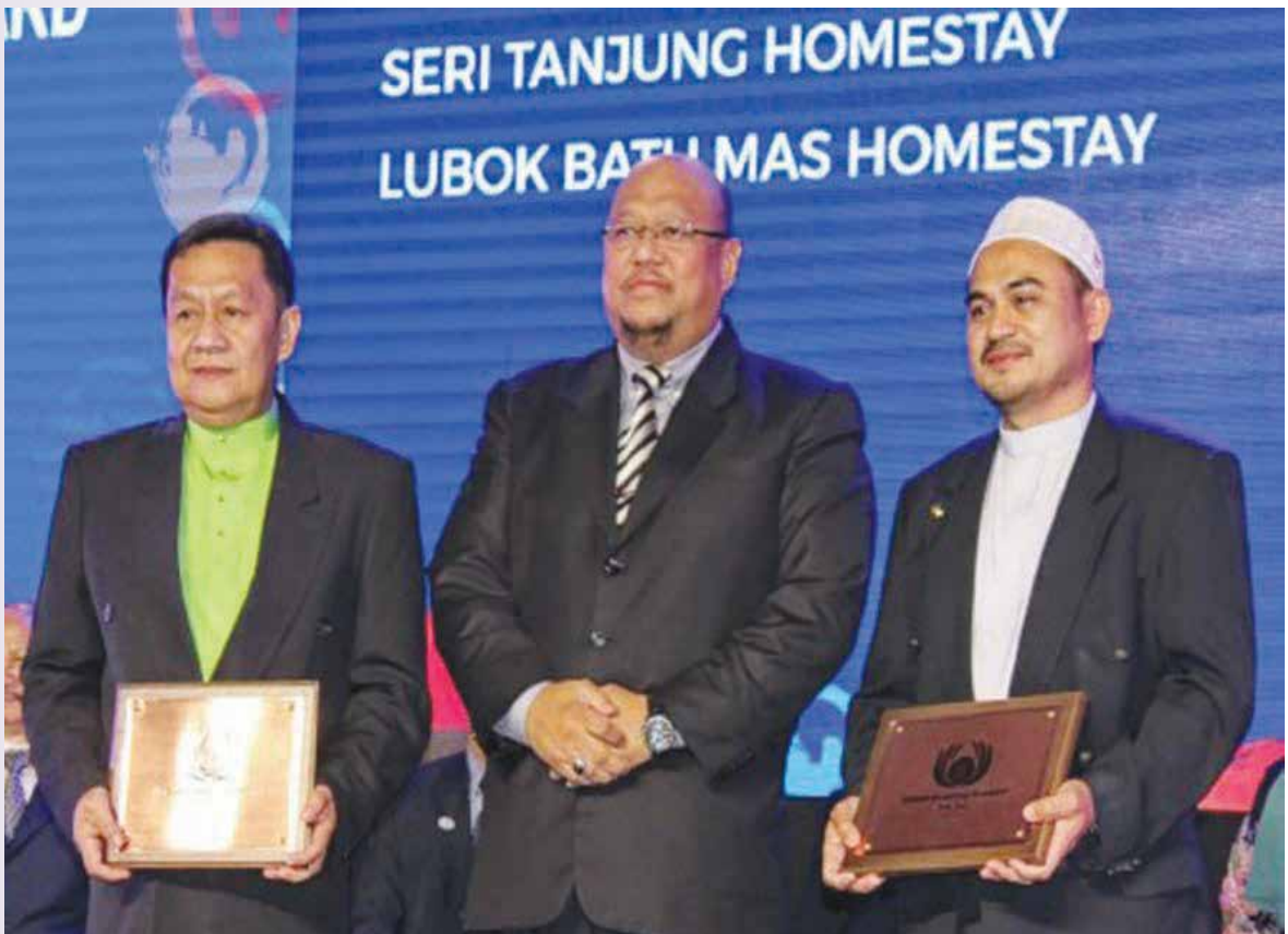
INAP Desa Lubuk Batu Mas, Kampung Sibut semasa menerima Anugerah Homestay ASEAN sempena berlangsungnya Mesyuarat Menteri-Menteri Pelancongan ASEAN Ke-19 di Manila, Filipina pada bulan Januari 2016.